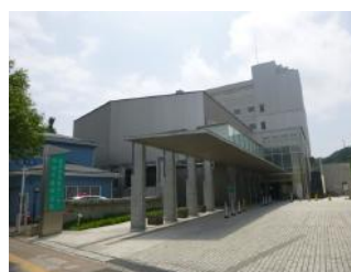
◀仙台市医師会館外観

■仙台市医師会館 (仙台市急患センター併設になっています) 最寄駅/地下鉄南北線「河原町駅」 宮城県仙台市若林区舟丁 64-12